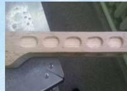
Имитация охлаждающих отверстий