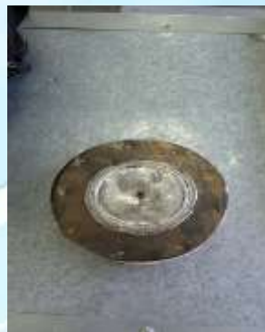
Обшивка магазина металлом