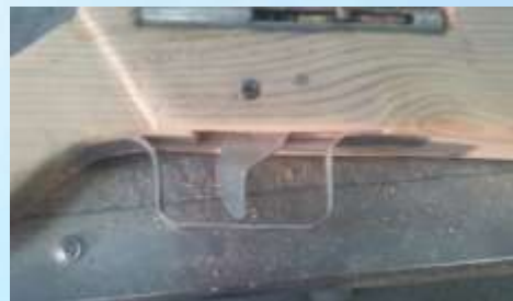
Имитация затвора, спускового крючка и спусковой скобы