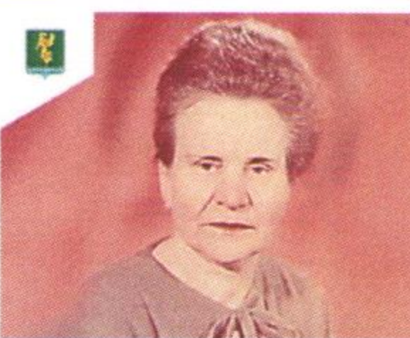
В ПАМЯТЬ О ЛЕГЕНДАРНОМ ПЕДАГОГЕ