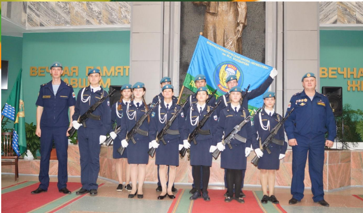
«СОШ № 6»