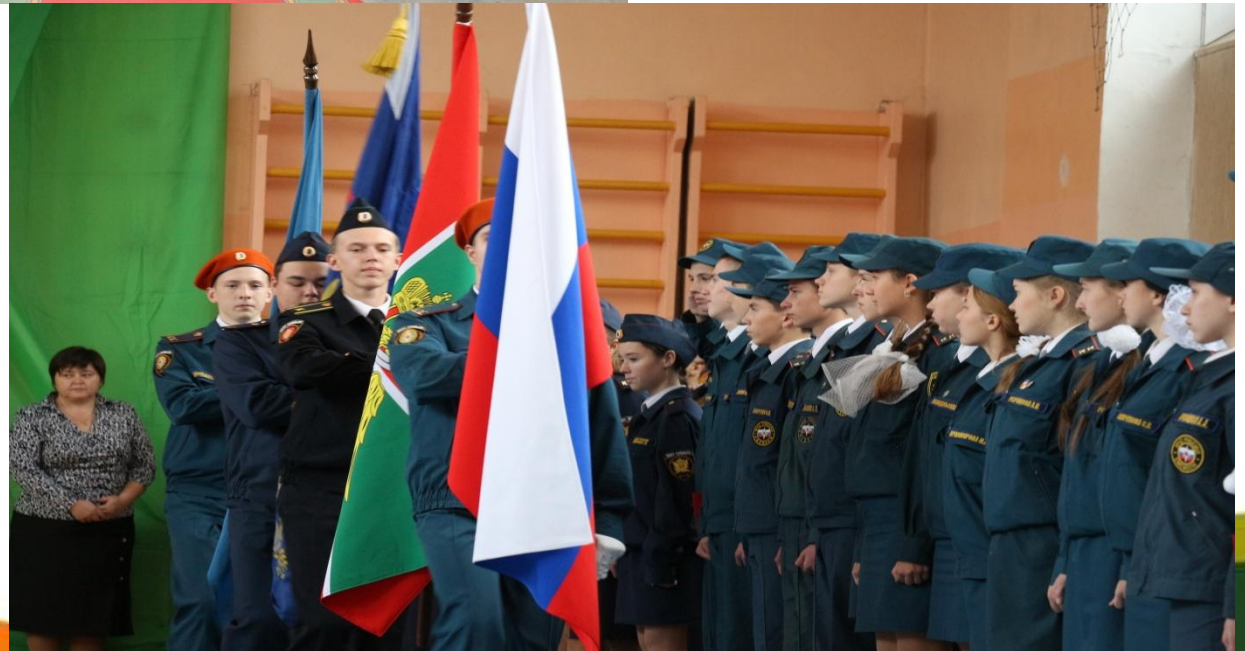
«СОШ № 39»